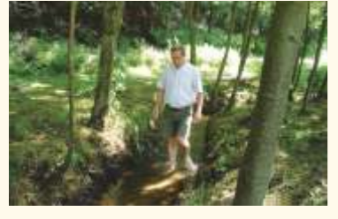
Barfußpfad im Poppental