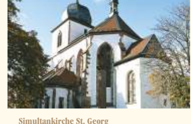
Simultankirche St. Georg